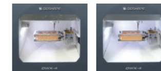
イオナイザーOFF イオナイザーON (イオナイザーは加工中、常に動作します)

集塵効果の高い機内構造とエアブローにより、加工中の機内を常にクリーンに保ちます。また、イオナイザーも装備し、PMMAの切削屑が静電気によって機内に付着するのを防ぎます。