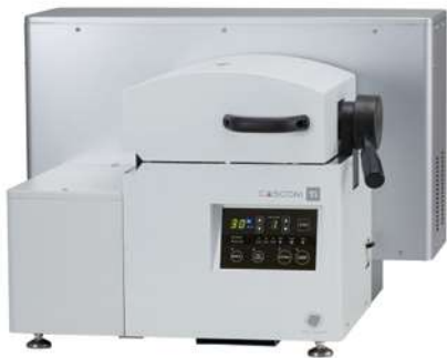
真空加圧鋳造機 キャスコムTi